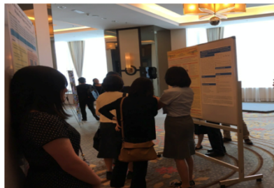
2017 APSMER(マラッカ)での ポスターセッション