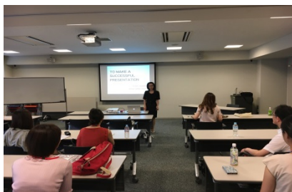
2016 目白ゼミナール（日本女子大学）

申込・問い合わせ： ongakukyoiku.hirooseminar@gmail.com