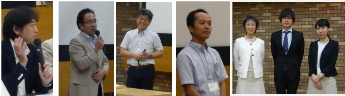
講演者の先生方とラウンドテーブル提案者