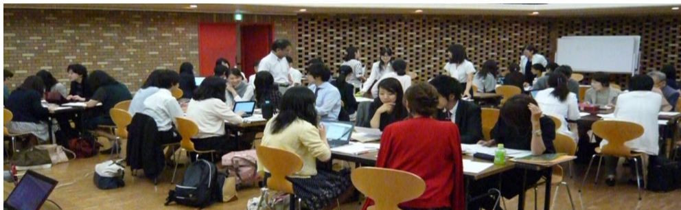
ゼミナール2日目・グループワークの様子

ゼミナール全体を通して、音楽科と他分野のそれぞれの実践研究の実際、そして研究の取り組み方について、議論や意見交換を交わしていく機会を積極的に作っていきたく強く感じた。