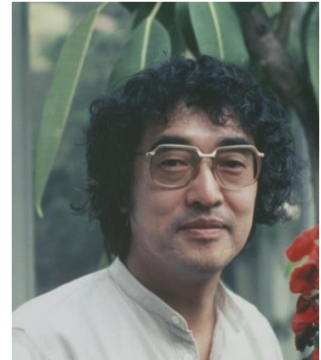
在りし日の小泉文夫先生

「小泉文夫」のネームバリューゆえか、それとも「民族音楽」への渴望ゆえか。演奏会の間、ずっと考えていた。都心でも珍しいこれほどの「熱い」聴衆が、この一つの催しに集まったという現象の示す意味を、私たちは問い続け、今後の音楽のあり方や音楽教育の進むべき方向を模索してゆく必要があるだろう。