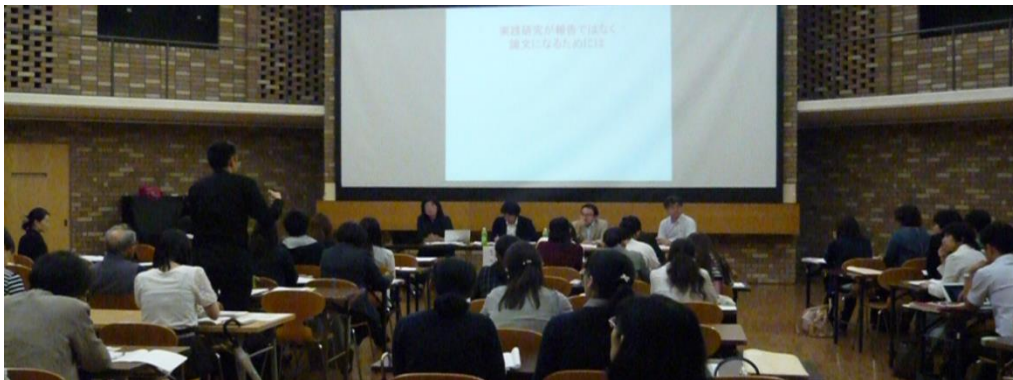
シンポジウム・全体討議