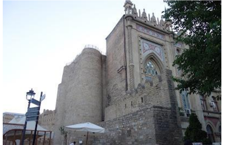
ダウンタウンの様子